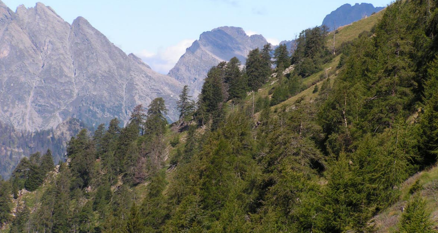
Im Val Leggio